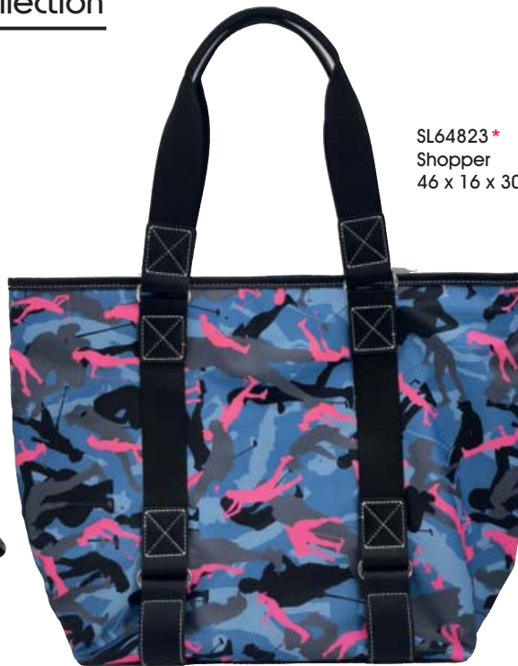
SL64823 * Shopper 46 x 16 x 30

sydney love sydney love sydney love sydney love sydney love sydney love sydney love sydney love sydney love sydney love trends