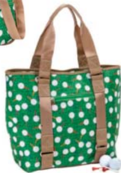
SL22723 Shopper 46 x 16 x 30