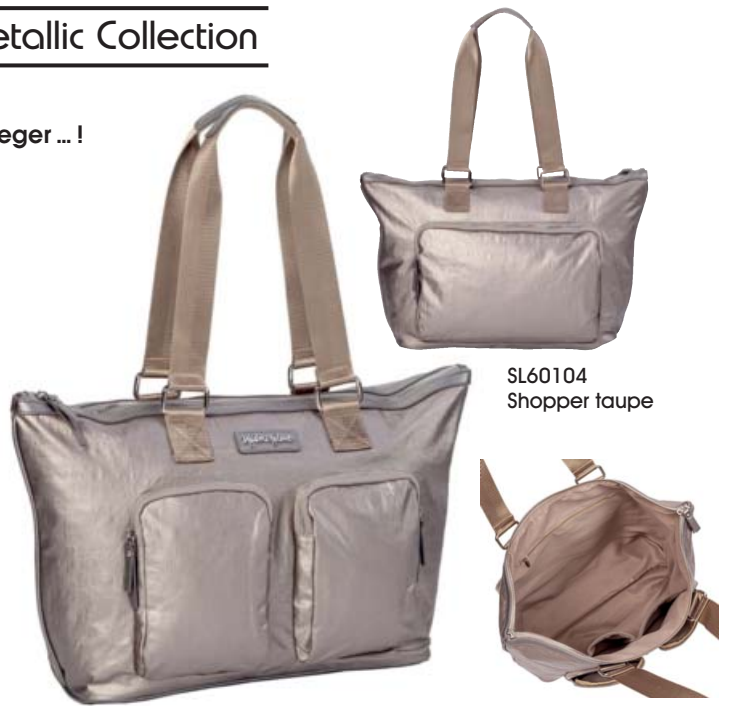
SL60104 Shopper taupe

Shopper (47,5 x 15 x 27,5): Business tasche oder nur lässig? Beides. Immer. Die Tasche für JEDE Gelegenheit. Smarte Außenfächer, geräumiger Innenraum mit Seitenfächern und Top-Reißverschluss. Alles sicher. Zu Recht ideal für den allerhöchsten Anspruch!