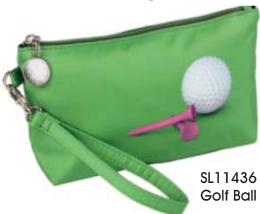
SL11436 Golf Ball & Tee