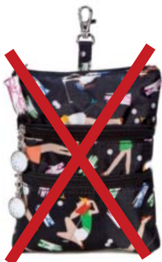
SL42716* Clip On Accessoire-Täschchen 22,5 x 18,75