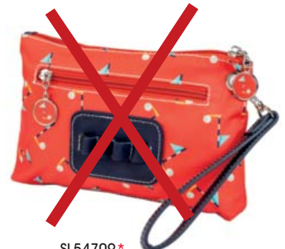
SL54709* Accessoire-Täschchen mit Tee-Halter 23 x 14