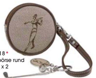
SL72718* Münzbörse rund Ø 9,5 x 2