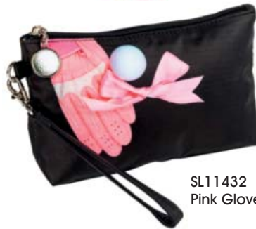
SL11432 Pink Glove & Ball