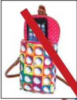
SL62713 Smartphone-Täschchen 12,50 x 10,75