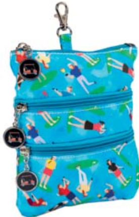
SL82816* Clip-On Accessoire-Täschchen 22,5 x 18,75