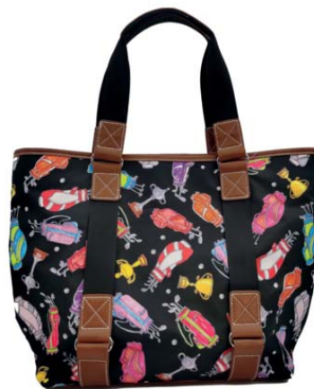
SL30223* Shopper 46 x 16 x 30