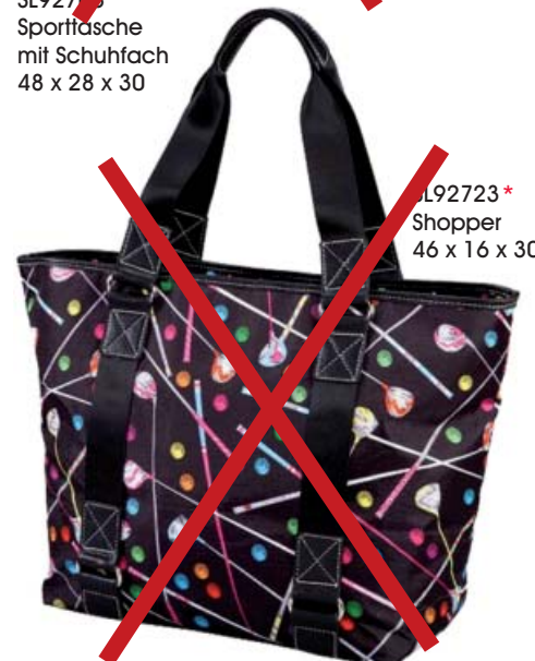
SL92723* Shopper 46 x 16 x 30