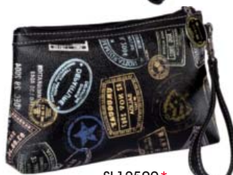
SL12509* Bon Voyage