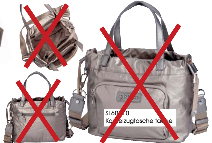
SL60110 Kordelzugtasche taupe

Kordelzugtasche (35 x 13,75 x 23,75): Romantik pur, nach Lust und Laune zu variieren. Top-Reißverschluss in atemberaubend schöner Lösung. Außergewöhnlich detailverliebt auch der 35 mm breite längenverstellbare, komfortable Schultergurt mit beidseitigen Karabinerhaken.