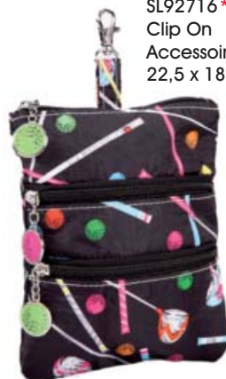
SL92716* Clip On Accessoire-Täschchen 22,5 x 18,75