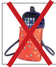
SL54713 Smartphone-Täschchen 12,50 x 18,75