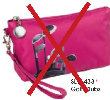
SL11433* Golf Clubs