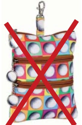
SL62716 Clip On Accessoire-Täschchen 22,5 x 18,75