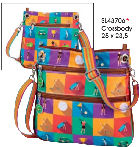
SL43706* Crossbody 25 x 23,5

Die sportliche Handtasche auch Offcourse! Außen zwei Front-Reißverschlüßfächer, eines auf der Rück- seite. Geräumiges Hauptfach mit seitlichem Reiß- verschlüßfach und zwei Steckfächern. Breiter ver- stellbarer Schultergurt in Komfortlänge 135 cm.