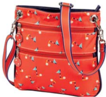
SL54706 Crossbody 25 x 23,5