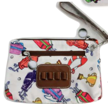
SL30109 Accessoire-Täschchen mit Tee-Halter 23 x 14