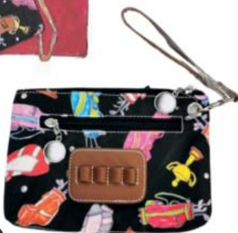
SL30209 Accessoire-Täschchen mit Tee-Halter 23 x 14