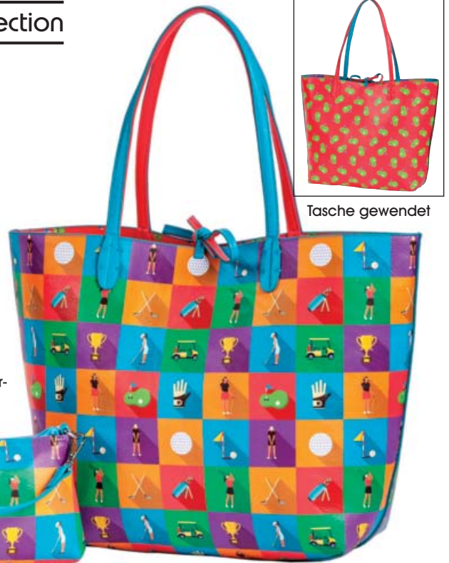
SL43703 Wendeshopper- Taschenset 48 x 18 x 30

Die sportliche Handtasche auch Offcourse! Außen zwei Front-Reißverschlüßfächer, eines auf der Rück- seite. Geräumiges Hauptfach mit seitlichem Reiß- verschlüßfach und zwei Steckfächern. Breiter ver- stellbarer Schultergurt in Komfortlänge 135 cm.