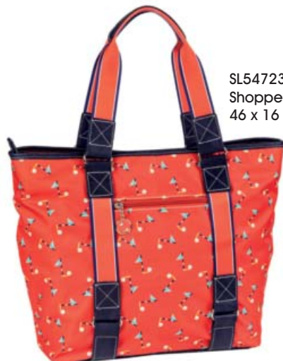
SL54723 Shopper 46 x 16 x 30