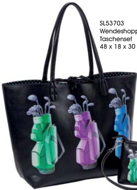
SL53703 Wendeshopper- Taschenset 48 x 18 x 30