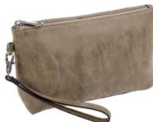
SL10453* Accessoire-Täschchen Natur (Wildlederoptik) 23 x 7 x 14