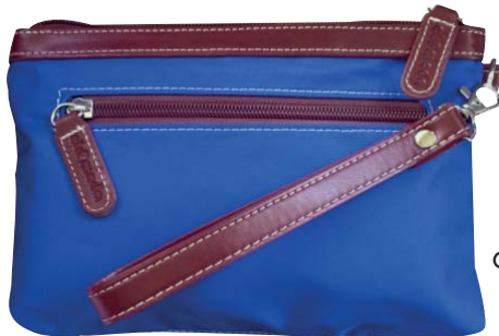
CBF11774 Classic Blau