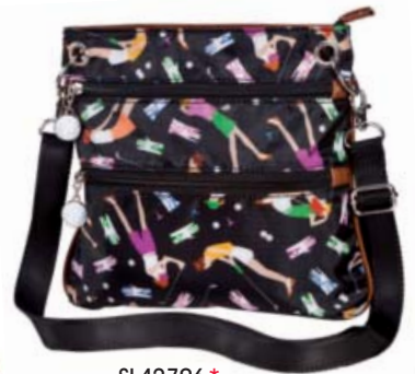
SL42706* Crossbody 25 x 23,5