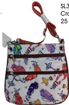
SL30106* Crossbody 25 x 23,5