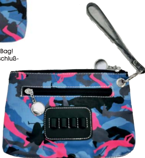
SL64809 Accessoire-Täschchen mit Tee-Halter 23 x 14

Der praktische Clip-On für's Bag! Hauptfach mit zwei Reißverschlüs- fächern außen.