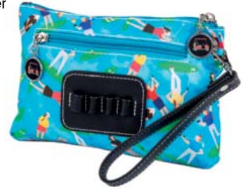
SL82809* Accessoire-Täschchen mit Tee-Halter 23 x 14