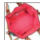
SL11422* Reisetasche 60 x 21 x 35