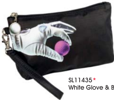
SL11435* White Glove & Ball

Sportlicher "Allrounder" mit Karabiner-Handschlaufe • seitliches Reißverschlußfach außen • Einsteckfach innen • Polka-Dot Innenfutter. 23 x 7 x 14 cm.