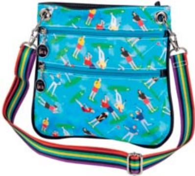
SL82806 Crossbody 25 x 23,5