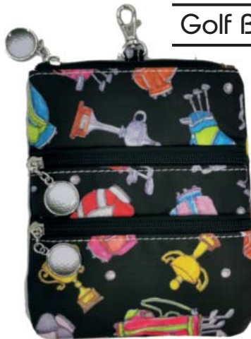
SL30216 Clip On Accessoire-Täschchen 22,5 x 18,75