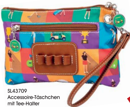
SL43709 Accessoire-Täschchen mit Tee-Halter 23 x 14

Sportliches Allrounder-Täschchen für Tees und andere wichtige Utensilien des Schönen Spiels! Karabiner-Handschlaufe. Reißverschlüßfach, innen seitliches Einsteck- und Reißverschlüßfach.