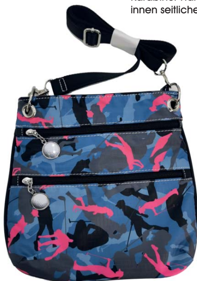
SL64806 * Crossbody 25 x 23,5

Sportliches Allrounder-Täschchen für Tees und andere wichtige Utensilien des Schönen Spiels! Karabiner-Handschlaufe. Reißverschlüßfach, innen seitliches Einsteck- und Reißverschlüßfach.