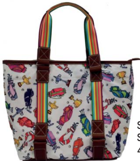
SL30123* Shopper 46 x 16 x 30