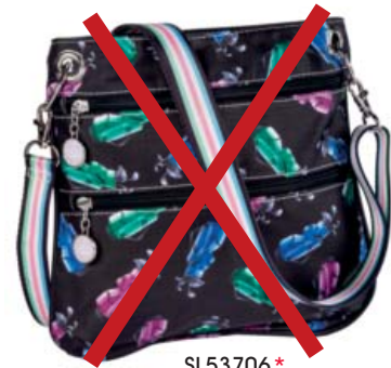
SL53706* Crossbody 25 x 23,5