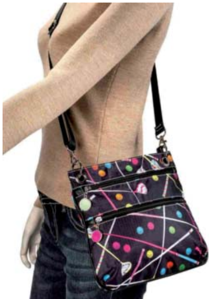
SL92709* Accessoire-Täschchen mit Tee-Halter 23 x 14