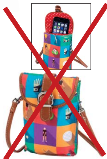
SL43713 Smartphone-Täschchen 12,50 x 18,75

Das smarteste Täschchen überhaupt! Zwei geräumige Innenfächer bieten Platz für Smartphone und wichtiges Allerlei unterwegs. Abnehmbarer Trageriem in Komfortlänge 120 cm.