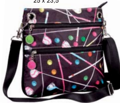
SL92706* Crossbody 25 x 23,5