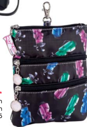
SL53716* Clip On Accessoire-Täschchen 22,5 x 18,75