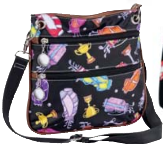
SL30206* Crossbody 25 x 23,5