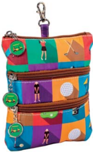
SL43716* Clip On Accessoire-Täschchen 22,5 x 18,75

Der praktische Clip-On fürs Bag! Hauptfach mit zwei Reißverschlüs- fächern außen.