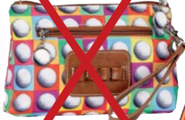
SL62709* Accessoire-Täschchen mit Tee-Halter 23 x 14