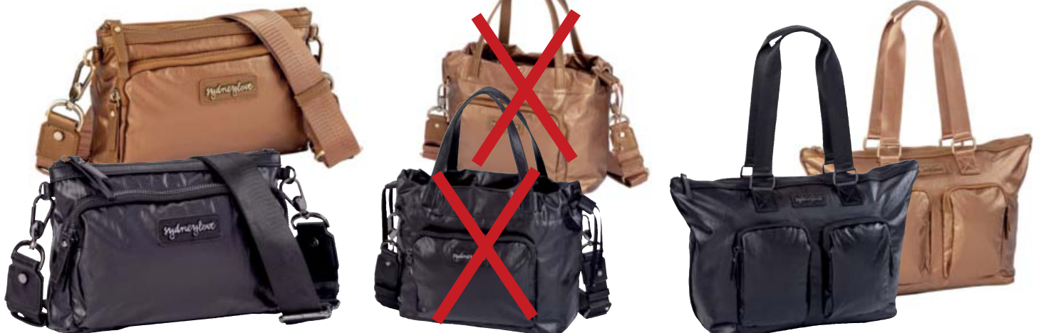
SL60106 Crossbody schwarz SL60108 Crossbody bronze

Kordelzugtasche (35 x 13,75 x 23,75): Romantik pur, nach Lust und Laune zu variieren. Top-Reißverschluss in atemberaubend schöner Lösung. Außergewöhnlich detailverliebt auch der 35 mm breite längenverstellbare, komfortable Schultergurt mit beidseitigen Karabinerhaken.