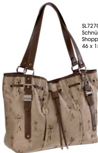
SL72703 Schnürkordel- Shopper 46 x 15 x 30