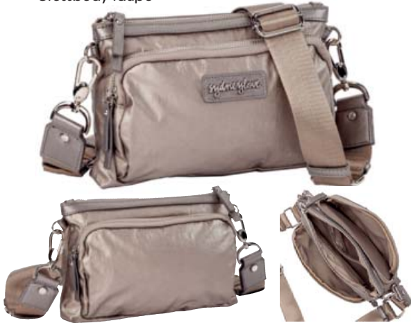
SL60107 Crossbody taupe

Crossbody (23,75 x 8,5 x 17,5): DAS Multi-Tasking-Talent! Die intelligente Fächerteilung sorgt für aufgeräumten Charme. Außergewöhnlich detailverliebt auch der 35 mm breite längenverstellbare, komfortable Schultergurt mit zwei Karabinerhaken.