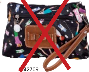
SL42709 Accessoire-Täschchen mit Tee-Halter 23 x 14