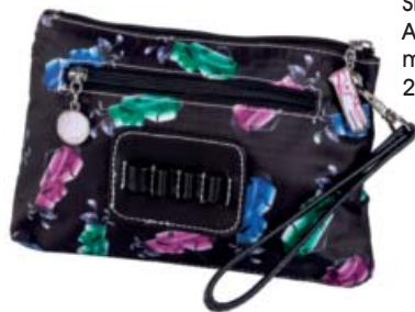
SL53709 Accessoire-Täschchen mit Tee-Halter 23 x 14