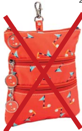
SL54716* Clip-On Accessoire-Täschchen 22,5 x 18,75