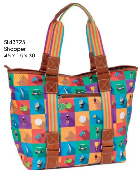
SL43723 Shopper 46 x 16 x 30

Das smarteste Täschchen überhaupt! Zwei geräumige Innenfächer bieten Platz für Smartphone und wichtiges Allerlei unterwegs. Abnehmbarer Trageriem in Komfortlänge 120 cm.