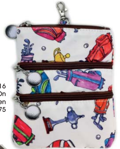
SL30116 Clip On Accessoire-Täschchen 22,5 x 18,75