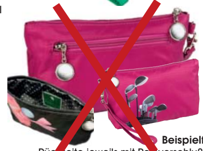
Beispielfotos Rückseite jeweils mit Reißverschlußfach Polka-Dot Innenfutter