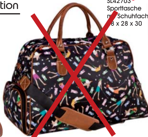
SL42703* Sporttasche mit Schuhfach 38 x 28 x 30