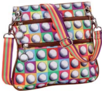
SL62706 Crossbody 25 x 23,5