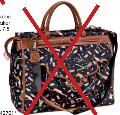
SL42701* Reisetasche 43 x 24 x 35