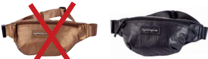
SL60114 Gürteltasche bronze