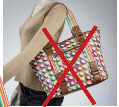
SL62723 Shopper 46 x 16 x 30