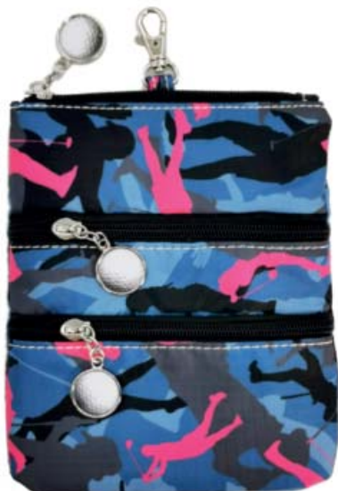
SL64816 Clip On Accessoire-Täschchen 22,5 x 18,75

Der praktische Clip-On für's Bag! Hauptfach mit zwei Reißverschlüs- fächern außen.