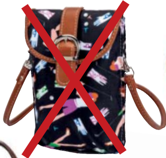
SL42713* Smartphone-Täschchen 12,50 x 18,75