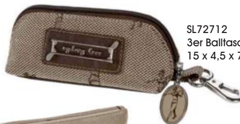
SL72712 3er Balltasche mit Tee-Halter 15 x 4,5 x 7,5