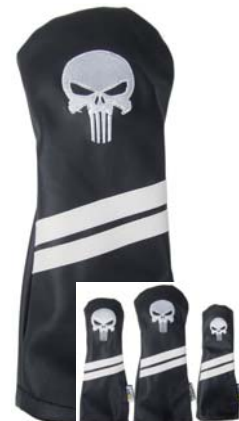
Punisher Skull schwarz Durableather

SF1107SS Driver SF1307SS Fairway SF1807SS Hybrid