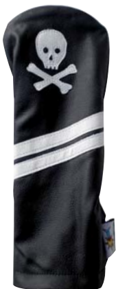
Bones Skull schwarz

SF1107 Driver SF1307 Fairway SF1507 Fairway SF1807 Hybrid