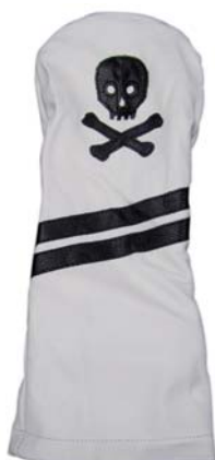
Bones Skull weiss

SF1101BS Driver SF1301BS Fairway SF1801BS Hybrid