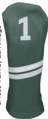
SF1503 Fairway auf Anfrage

SF1102 Driver SF1302 Fairway SF1502 Fairway SF1802 Hybrid