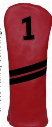
SF1505 Fairway auf Anfrage

SF1104 Driver SF1304 Fairway SF1504 Fairway SF1804 Hybrid