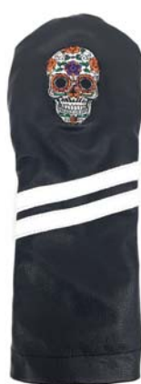
Sugar Skull schwarz

SF1107BS Driver SF1307BS Fairway SF1807BS Hybrid