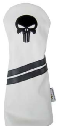
Punisher Skull weiss Durableather

SF2101PS Driver SF2301PS Fairway SF2801PS Hybrid