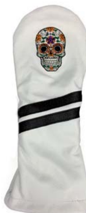
Sugar Skull weiss

SF1101SS Driver SF1301SS Fairway SF1801SS Hybrid